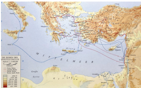
Missionsreisen des Paulus

Einem Weltreisenden gibt es auch schon in der Bibel. Zumindest die damals bekannte Welt hat er bereist. Per „Work and Travel“. Na ja, fast. Von Jerusalem über Illyrien bis nach Rom ist er gekommen. Dort wurde er hingerichtet. Sein Ziel wäre Spanien gewesen. Dann hätte er es geschafft – die Weltreise. Gemeint ist der APOSTEL PAULUS , ein Wandermissionar, der den christlichen Glauben in Europa verbreitet hat. Wichtig war ihm: selbst für seinen Unterhalt zu arbeiten. Wenn es sein musste auch nachts – um niemandem zur Last zu fallen (2Thess 3,8).